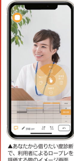
あなたから借りたい度診断で、利用者によるロープレを評価する際のイメージ画面

賃貸仲介専門の落合不動産(神奈川県相模原市)は、賃貸仲介の営業力向上を支援するサービスの提供を11月14日から開始した。10社限定で利用者を募集したところ、13社 から申し込みがあった。サービス名は「あなたから借りたい度診断」。営業教育に特化したシステム開発とコンサルティングを行うCoo Growth(コークロス)と協業して作成したもの。Coo Growthが2016年から展開する営業力向上コンサルティングシステム「あなたから借りたい度診断」で、利用者によるロープレを評価する際のイメージ画面